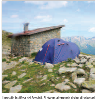
Il presidio in difesa dei Serodoli. Si stanno alternando decine di volontari

la «montagna sacra», risponde candidamente: «Sono i No Tav, andiamo giù». «Noi siamo scitiche. Noi crediamo che la montagna sia un luogo dedicato alla contemplazione e all'apprendimento della bellezza, alla fatica, al riposo della mente e alla riscoperta della propria padra e spiritualità». Ni. Gua.